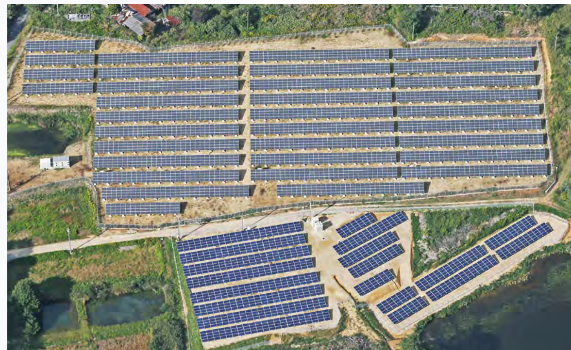
広島県世羅郡のメガソーラー(945.00kW+330.40kW増設)

これまでにハウス事業で培った建築士による設計・構造計算、電気施工管理士による電気システムの設計、鉄骨のスペシャリストによる鉄骨架台の施工管理、その他優秀なスタッフによる補助金等の申請手続きのお手伝いやアフターサービス、これらの一貫したサービスのご提供がオービスの最大の特徴です。