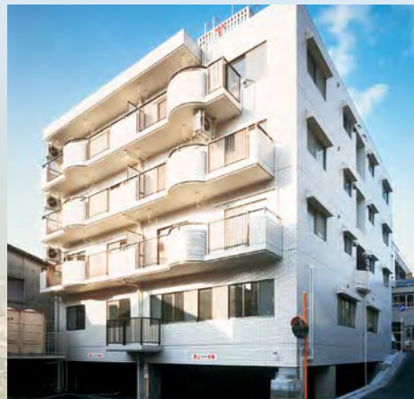
アーバン中浜(広島県広島市)

不動産事業では、広島県内の4ヶ所に賃貸マンションを所有し、賃貸事業を行っております。福山市の物件におきましては、一般賃貸に加え、ウィークリータイプのマンションとしてのサービスも行っており、低価格な料金設定により好評をいただいております。リピーターの確保にも努めております。