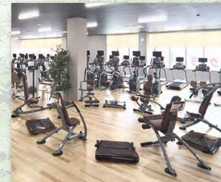
スポバル緑町クラブ