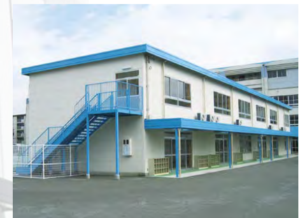
プレハブハウス施工例