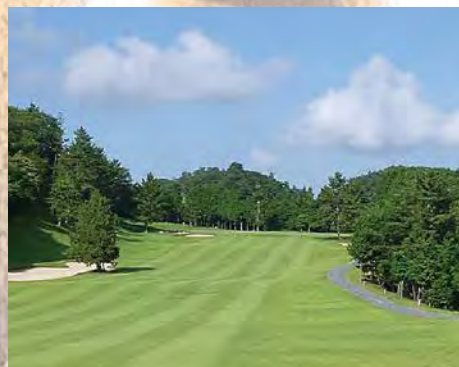
中須ゴルフ倶楽部

山口県周南市にある中須ゴルフ倶楽部は、18ホール全長7,125ヤードのワイドでフラットなロングコースで、かの中村寅吉が設計した名門コースとして皆様から長年ご支持とご愛顧をいただいております。クラブハウス内の弱アルカリ温泉「名物天然大岩風呂」は、日頃の疲れを癒し、明日への活力を与えてくれると好評をいただいております。