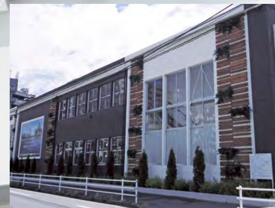
プレハブハウス施工例

プレハブハウスの最大の特徴は、工期の短さと低価格という手軽さ。しかしながら近年では、耐震性や安全性を厳しく求められています。オービスのプレハブハウスは、安全性と利便性を融合させた次世代のプレハブハウスです。短期間の仮設ハウスのリースから常設の店舗等の販売まで、お客様の様々なニーズに対応した細かなサービスで、安心安全の快適環境をご提供いたします。