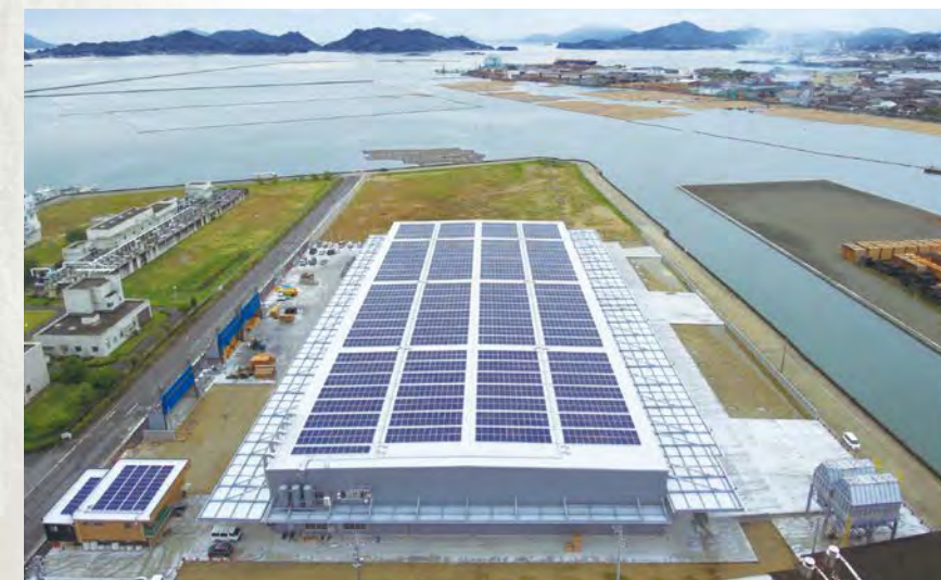
福山工場(広島県福山市)