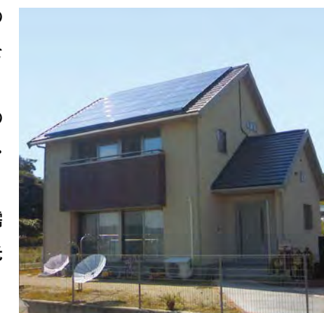
住宅用太陽光発電システム(4.44kW)施工例

産業用の太陽光発電の全量買取制がスタートしたことにより、需要が急激に拡大し、1000kW以上=1メガワットの発電力をもつ太陽光発電システムを設置して発電事業へ参入する企業も増加しました。