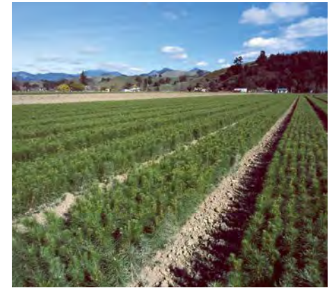
ラジアータパインの苗木畑

ラジアータパインの大きな特徴は、成長が早い植林材であるということです。ニュージーランド政府の政策により森林資源の活用が図られ、計画的に伐採、植林が行われるため、枯渇することなく安定的に供給が受けられる資源であると考えられております。環境問題がクローズアップされる昨今、植林により常に新しい森林を生み出し、育てるラジアータパインは、二酸化炭素削減に貢献できる“地球にやさしい”木材であると考えられております。近年では品種改良が進み、ラジアータパインは25年という短期間で成木になるといわれております。