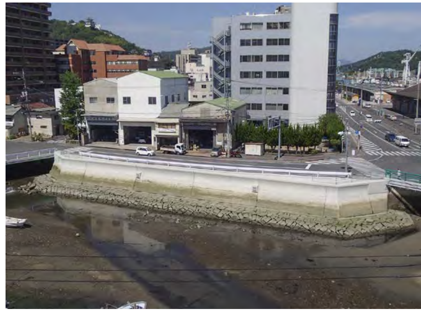
■重要港湾尾道糸崎港港湾海岸保全工事(尾道地区)