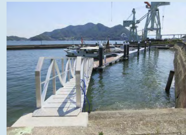
■千年港港湾整備交付金工事(岩船地区)