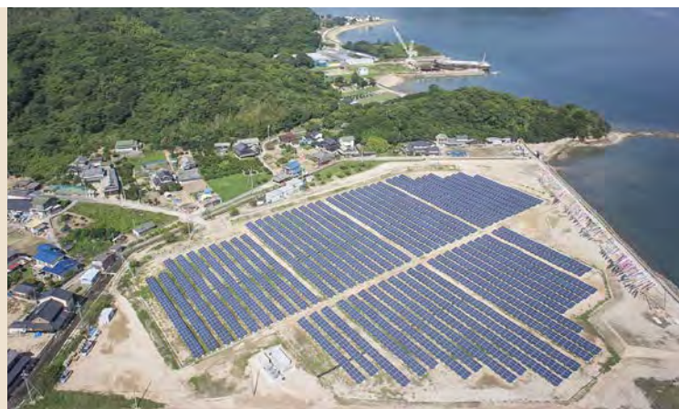
■百島太陽光発電所工事