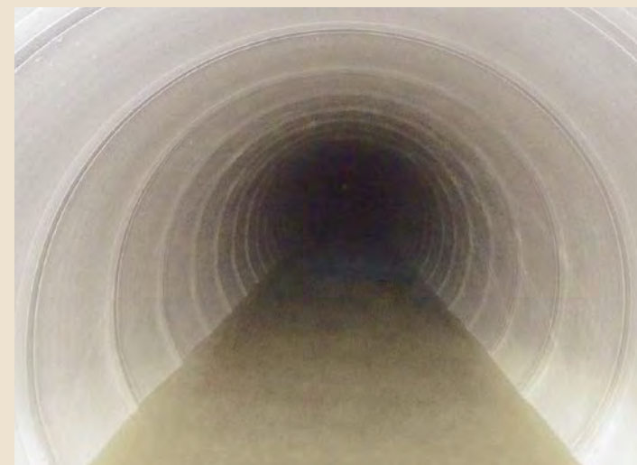
■沼田川流域下水道 沼田川幹線管渠管更生工事