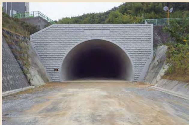
■一般国道317号(青影バイパス) 道路改良工事(仮称)新青影トンネル