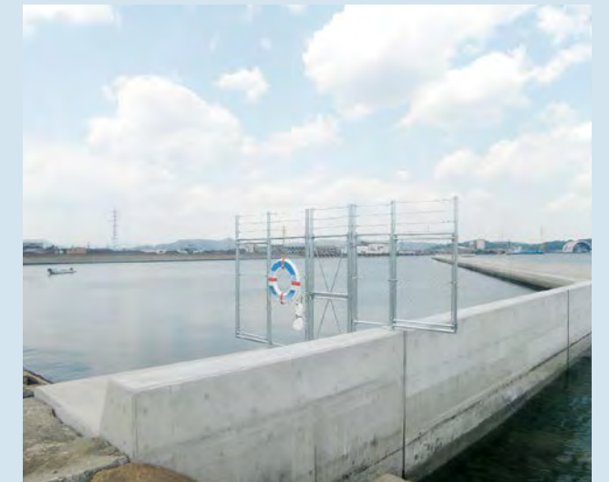
■福山港 港湾修築工事(一文字地区 24-2 工区)