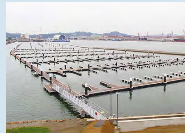
■福山港港湾修築工事(一文字ポートパーク)