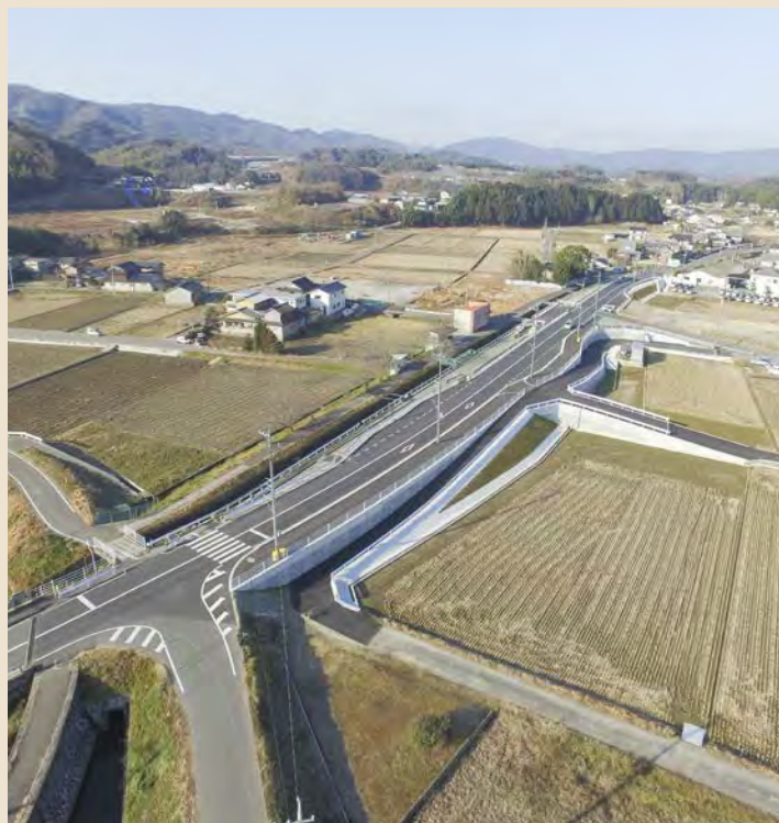
■津之郷山守線(福山西環状線) 道路改良工事(2工区)