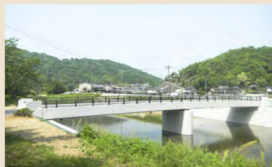
■西藤42号線(兵庫橋) 橋梁架替工事