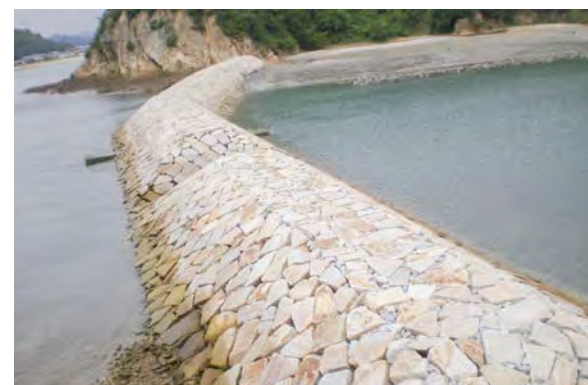
■石積護岸災害復旧工事