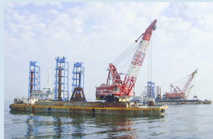
■鹿島港外港地区外港航路浚渫工事