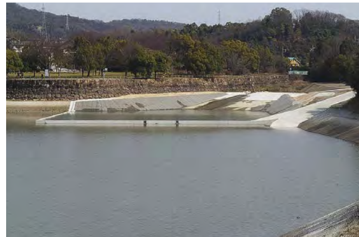
■手城川広域河川改修工事2工区(土工事)