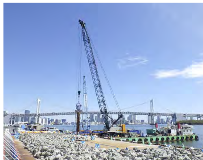
■品川内賢ふ頭岸壁(-8.5m)改良整備工事