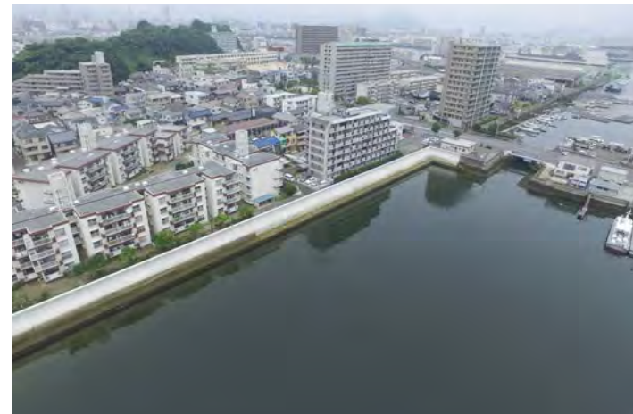
■広島港海岸中央西地区(江波)護岸(改良)築造工事