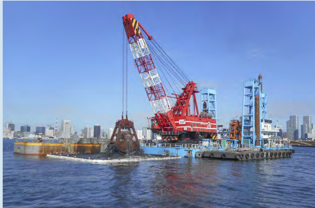
■豊洲地区ガスパイプライン撤去工事