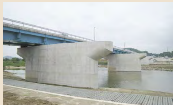
■芦田川山手橋下部その2工事