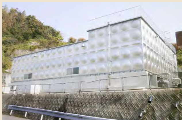
■田熊ポンプ場築造工事