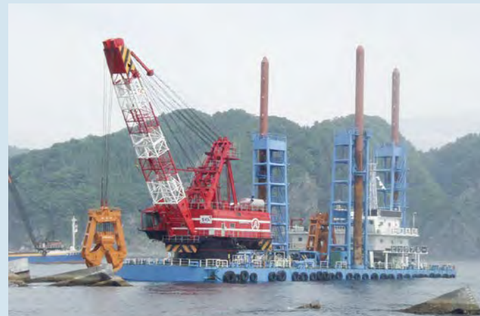
■釜石港湾口地区湾口防波堤(災害復旧)防波堤撤去工事