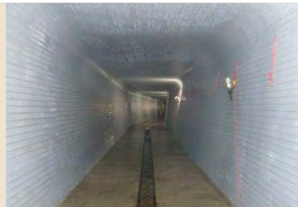
■防地川河川改良工事【パルテム工法】