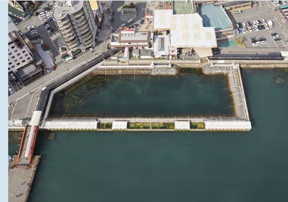
■敵島港みなとの賑わいづくり事業埋立工事(2-3工区)