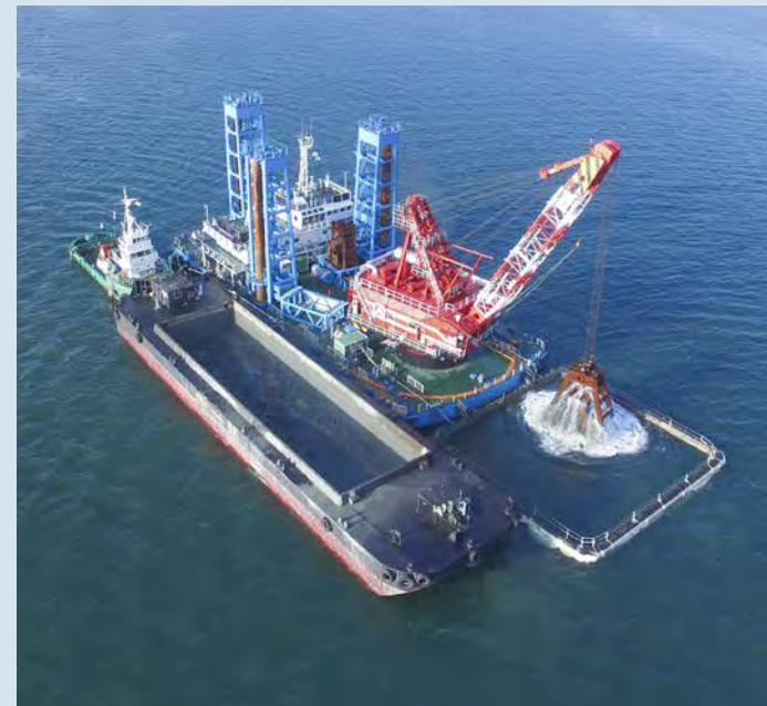
■水島港玉島地区航路・泊地(-12m)等浚渫工事