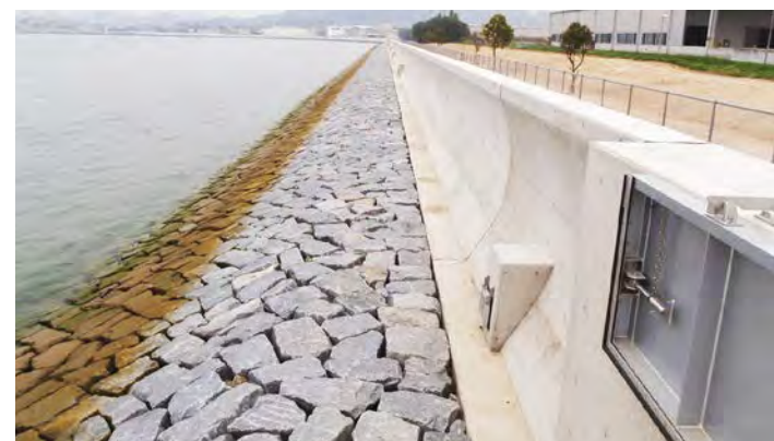
■海岸高潮老化対策緊急工事(山波2工区)